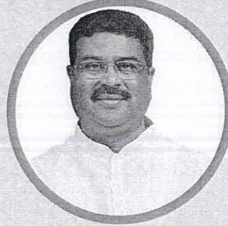
श्री धर्मेन्द्र प्रधान

अखिल भारतीय तकनीकी शिक्षा परिषद, नई दिल्ली