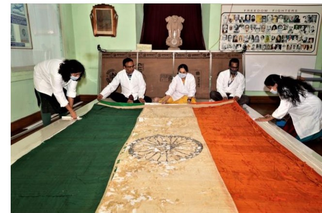
Inserting of new white silk cloth support beneath the tri colour support with rolling method